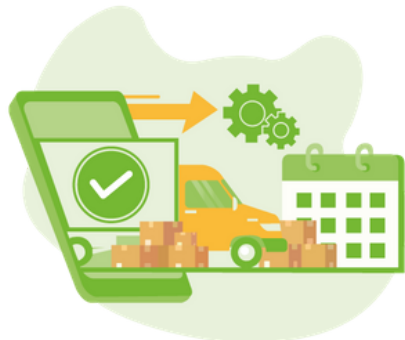
MODULO GESTIÓN USADOS