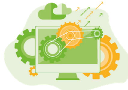
CRM COMERCIAL CONSULTA